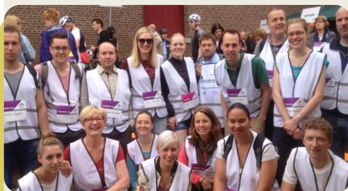
Het EnCoRe-team in de startblokken voor Five4Five

Ook dit jaar, op 28 mei jl., heeft het EnCoRe-team zich van haar sportieve kant laten zien door mee te doen met Five4Five ( www.five4five.nl ), een actie georganiseerd door het Kankeronderzoekfonds Limburg.